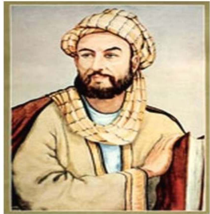
Әбу Әли Хусейн ибн Абдуллах ибн аль- Хасан ибн Әли ибн Сина

Ибн Сина өзінен кейін зор шығармашылық мұра қалдырып кетті: ертедегі деректерге қарасақ, ол 456-ге жуық еңбек жазды, бірақ бізге дейін оның 240 кітабы ғана жетті, ол еңбектер поэзия мен философиядан бастап, геология және астрономиямен аяқталып, білімнің барлық саласына арналған. Үлкен атаққа Ибн Сина дәрігер, ғалым және фармацевт ретінде ие болды. Ол бар болғаны 57 жыл өмір сүрсе де (980-1037 жылдары), оның өмірі мен дарыны осы уақытқа дейін аңызға айналып келеді.